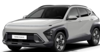
„Cyber Grey“ sidabrinė metalo blizgesio (CSG)