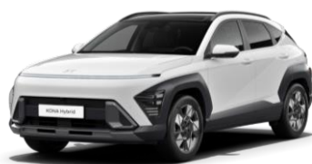
„Atlas White“ balta (SAW)