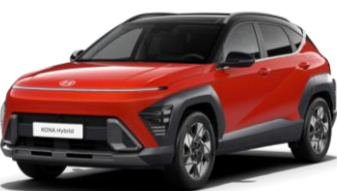
„Soultronic Orange“ oranžinė perlamutrinė (SO0)* / juodas stogas