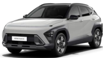
„Cyper Grey“ sidabrinė metalo blizgesio (C50) / juodas stogas