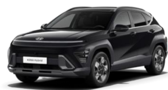
„Abys Black“ juoda perlmutrinė (A2B)

„Mirage Green“ pilkai melsva – nemokamai 0 € Metalo blizgesio ir perlmutrinė spalva 550 €