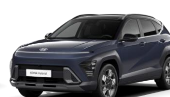
„Denim Blue“ tamsiai mėlyna perlamutrinė (TN0) / juodas stogas