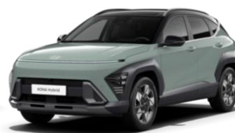
„Mirage Green“ pilkai melsva (RR0) / juodas stogas