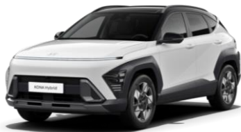
„Atlas White“ balta (SA0) / juodas stogas

„Phantom Black“ juodas stogas „Phantom Black“ juodas stogas 590 €