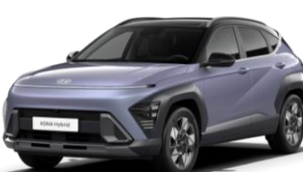
„Meta Blue“ mėlyna perlamutrinė (PM0)* / juodas stogas