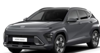
„Ecotronic Gray“ pilkai perlmutrinė (PE2)