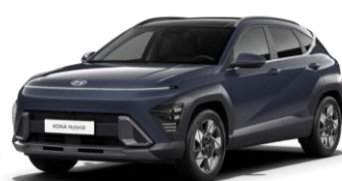
„Denim Blue“ tamsiai mėlyna perlmutrinė (TN6)