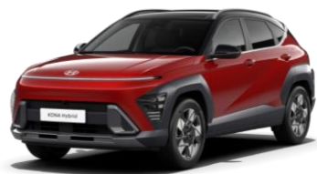
„Ultimate Red“ raudona metalo blizgesio (R20) / juodas stogas