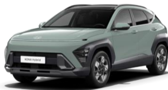
„Mirage Green“ pilkai melsva (RRR) - nemokamai