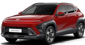
„Ultimate Red“ raudona metalo blizgesio (R2P)