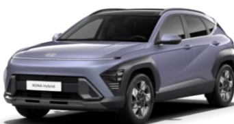
„Meta Blue“ mėlyna perlmutrinė (PM2)*