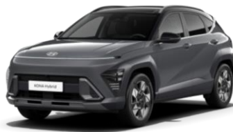
„Ecotronic Gray“ pilka perlamutrinė (PE0) / juodas stogas